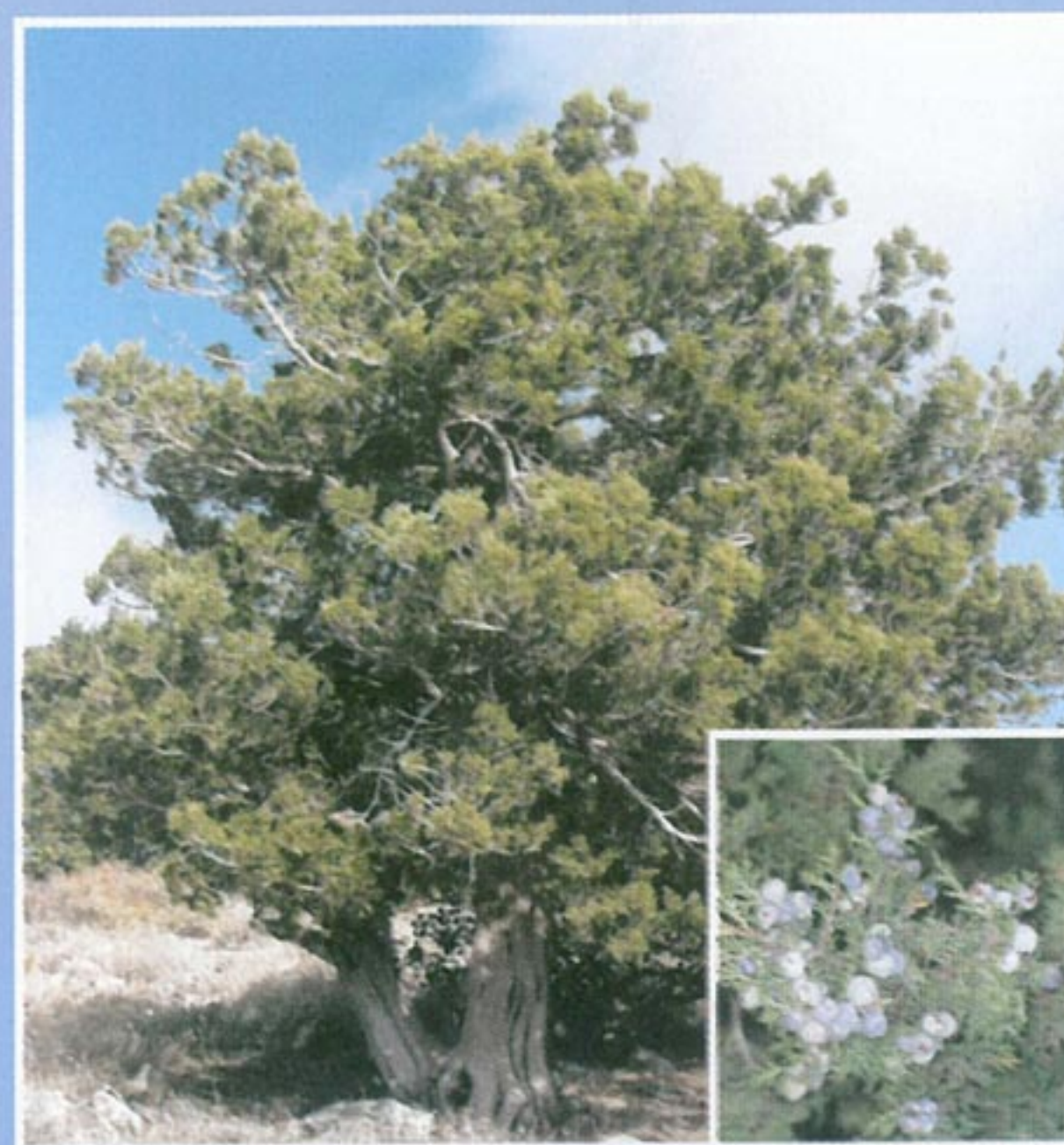
Juniperus excelsa M. Biem - Άρκευθος η υψηλή.